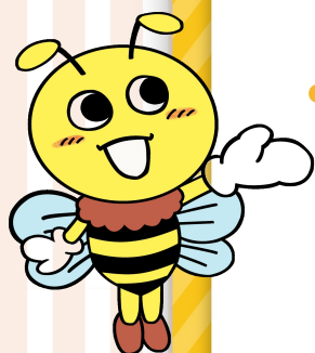
川崎医療生協 公式マスコット はっちくん